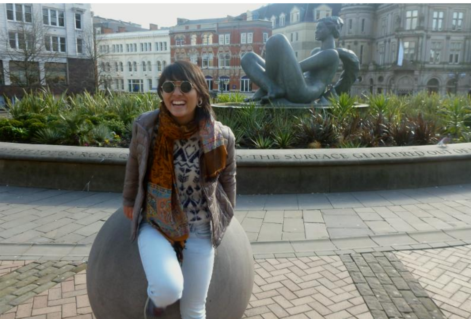
Victoria Square e eu super descontraída tentando subir na pedra