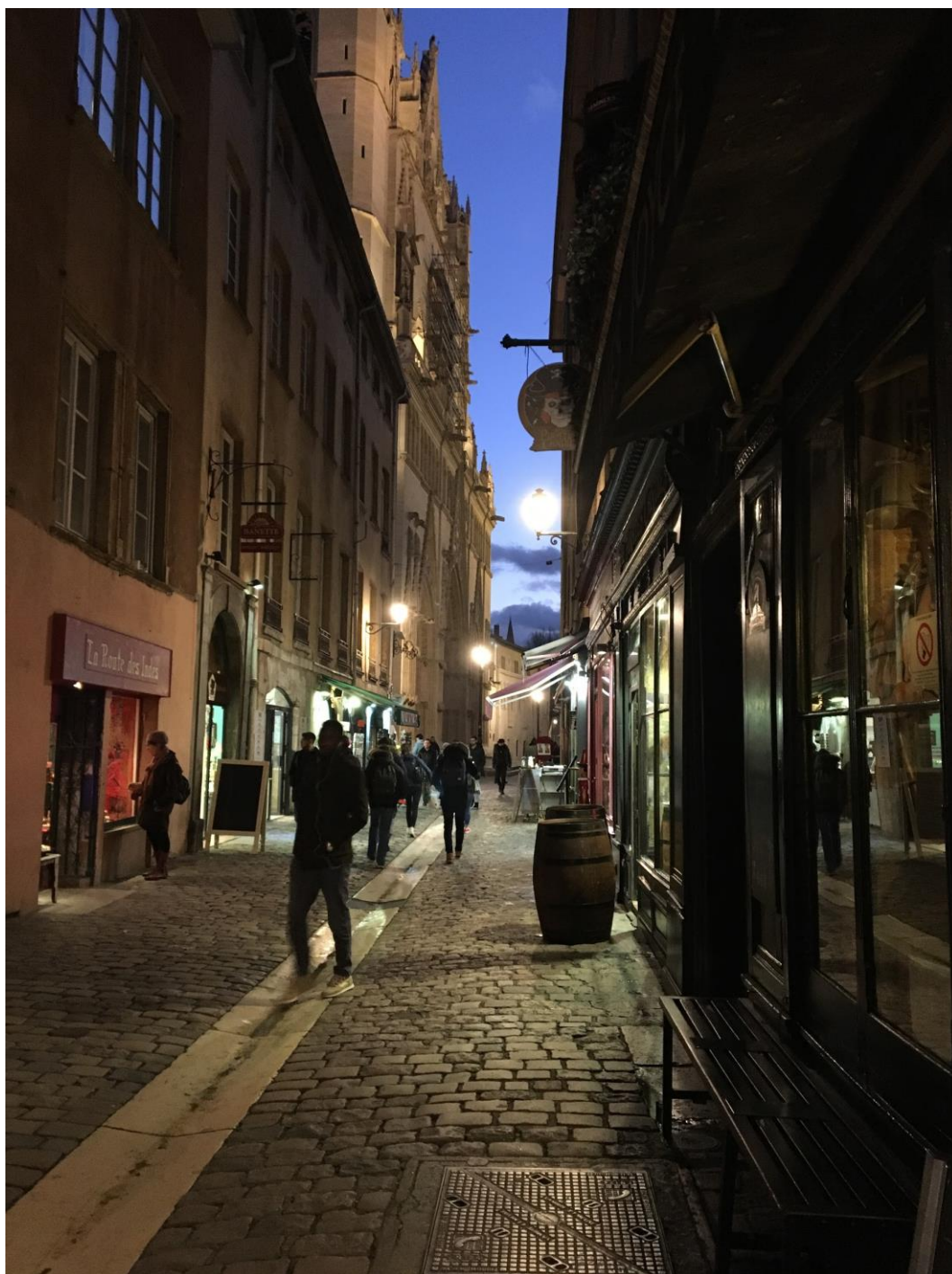
Bairro Vieux Lyon