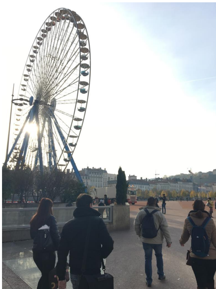
Place Bellecour (centro da cidade)